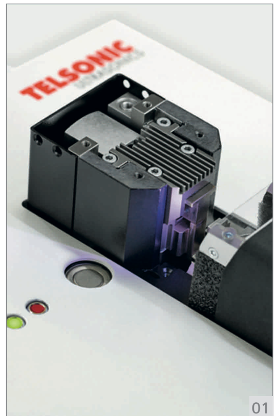
01 Einblick auf das Performancekit mit Ambosskühlung

Zu den weiteren Verbesserungen gehören eine längere Lebensdauer der Klinge des Schlechtteilschneiders und ein robusteres Design des Schrittmotors.