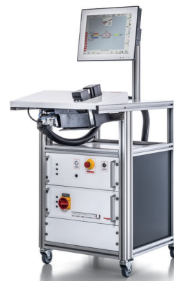
束焊机 Telso®Splice TS3

2014 年 ，数字式高功率超声波电箱 MAG 投入市场，是 Telsonic 公司另一项重大的技术突破。灵活的总线系统为设备制造商在集成过程中提供支持，并能同时满足日益增长的“工业 4.0”要求。