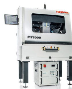
金属焊接机架 MT 8000