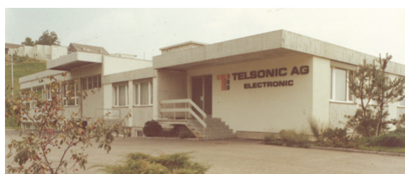
1975 年至 1988 年