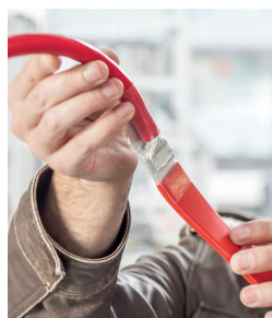
泰索涅克的专利技术