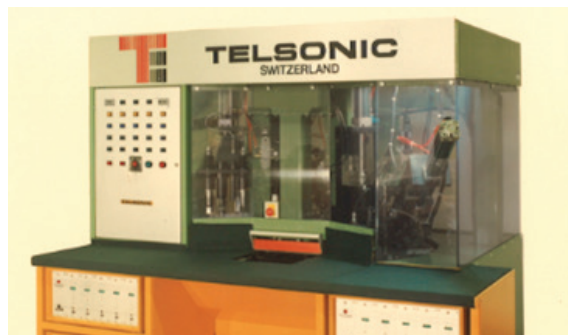
多换能器焊接设备

1994 年 ，推出超声波筛选系统 SONOSCREEN®，极大地丰富了产品类别。