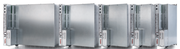
带有总线模块的 MAG 超声波电箱