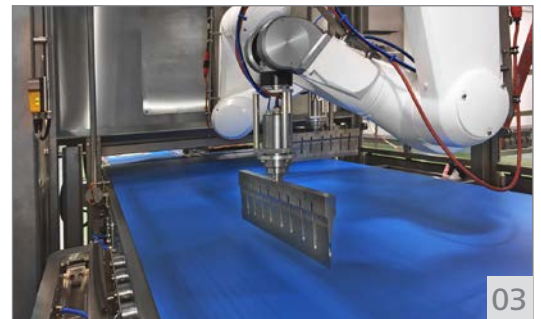
01 Telsonic 新款 760mm 刀片进一步提高了盘烤制品机器 02 人上的超声系统的效率和生产率 03